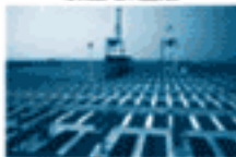
オープンしたがコンテナは全く集まらないのびきコンテナターミナル