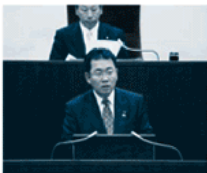
本議会で質問 (3月10日)