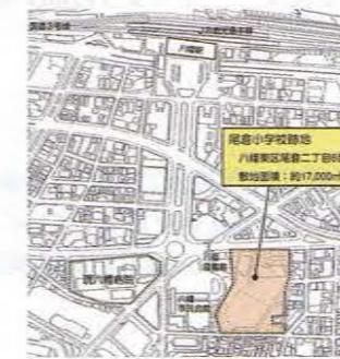
〈新市立八幡病院建設予定地位置図〉

老朽化・機能的に狭い市立八幡病院を八幡東区旧尾倉小学校跡地に建て替えます。平成29年度完成予定です。救命救急、小児救急、災害拠点病院としての機能を強化します。